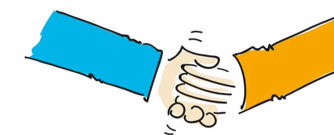
Betriebliches Gesundheits- und Case-Management