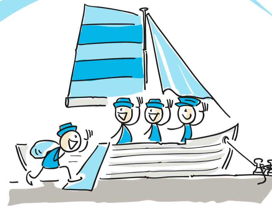
Unternehmenskultur mit starkem Mitarbeiterfokus