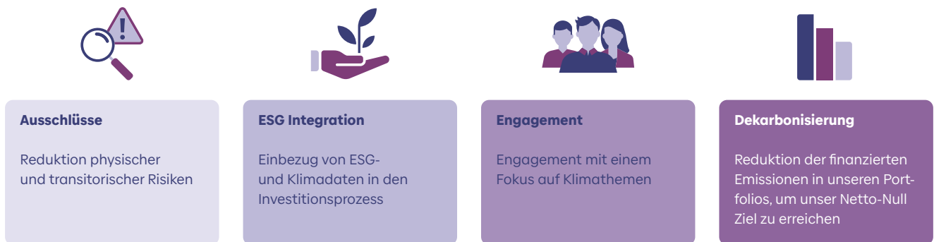
Abbildung 2: Die Klimastrategie von Baloise Asset Management basiert auf vier Säulen

Mehr Informationen über die Klimastrategie sind unter den folgenden Link abrufbar: https://www.baloise.com/de/home/ueber-uns/wofuer-wir-stehen/nachhaltigkeit.html