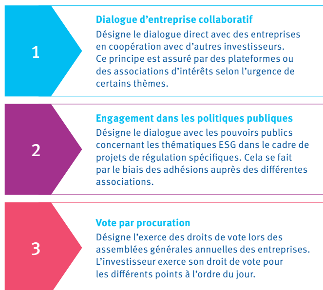
Fig. 1: Stratégie d'active ownership de la Baloise en 3 piliers

Engagement: dans le cadre de notre politique Active Ownership (cf. www.baloise-asset-management.com/dam/baloise-asset-management-com/documents/en/nachhaltigkeit/BAM_Strategie-Active-Ownership_EN_210301.pdf ), nous menons un dialogue actif avec les entreprises privées ou le secteur public sur des questions ESG spécifiques ou transversales via nos participations aux associations professionnelles (p. ex. PRI, ASA, AMAS, SSF). Notre approche «Active Ownership» vise à produire des rendements durables à long terme tout en créant des effets environnementaux et sociaux positifs.