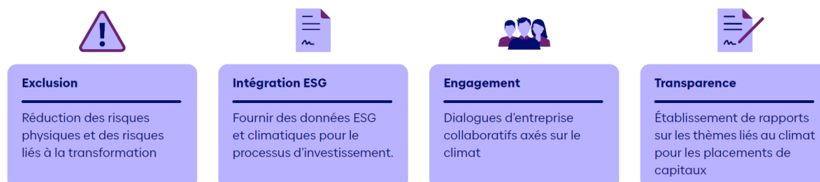
Illustration 2 : les 4 piliers de la stratégie climatique de Baloise Asset Management

Notre stratégie climatique comporte quatre piliers stratégiques et fait partie intégrante de notre stratégie RI générale et ainsi de la présente directive :